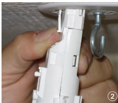
Enlevez la douille en appuyant sur la patte souple située à sa base