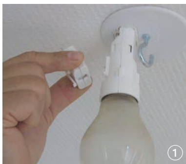
Retirez la fiche DCL