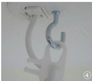
Raccordez la fiche par simple enclipsage directement dans le socle du connecteur. Suspendez le fil du luminaire au crochet prévu.

Votre raccordement électrique est maintenant sécurisé. A votre départ, vous n'avez plus qu'à déclipser la fiche. Raccorder un luminaire devient aussi facile que de brancher une prise de courant !