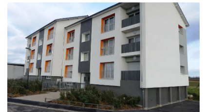
A Vézelize, requalification d'un quartier par la démolition d'un immeuble et la réhabilitation de 3 résidences