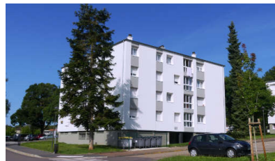
L'une des 7 résidences réhabilitée dans le quartier Bois La Sarre à Homécourt (104 logements)

Depuis plusieurs années, nous avons engagé un vaste programme de travaux de réhabilitation concernant plusieurs milliers de logements pour répondre à l'urgence écologique des années à venir et réduire la consommation énergétique des résidents. 388 logements ont été rénovés l'année dernière et les travaux pour 232 autres le seront cette année. Ces travaux bénéficient pour partie du soutien financier de l'Union Européenne. Ils participent à la nécessité d'accompagner la transition écologique et l'évolution des besoins des locataires.