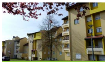
Saint-Max résidence Maquis de Ranzey

90% des logements de mmH ont une étiquette énergie en A et D pour une meilleure maîtrise de vos charges