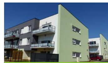
Hussigny-Godbrange résidences Charlotte Delbo