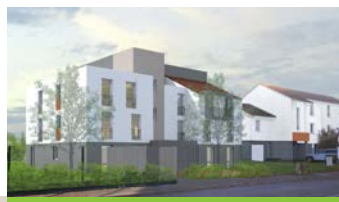
Ludres, résidences Aquarelles 3 ème trimestre 2019 Cabinet d'architecture : agence Rabolini Schlegel & associés