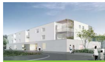
Tomblaine, résidence Le Diapason à destination des séniors avec une crèche en rez-de-chaussée - 4 ème trimestre 2019 cabinet d'architecture : KL architectes