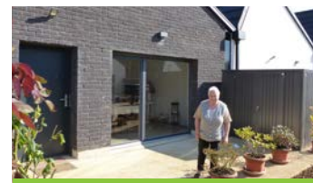
Jœuf résidence Winston Churchill à destination des séniors