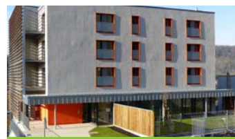
Liverdun résidence Beausite